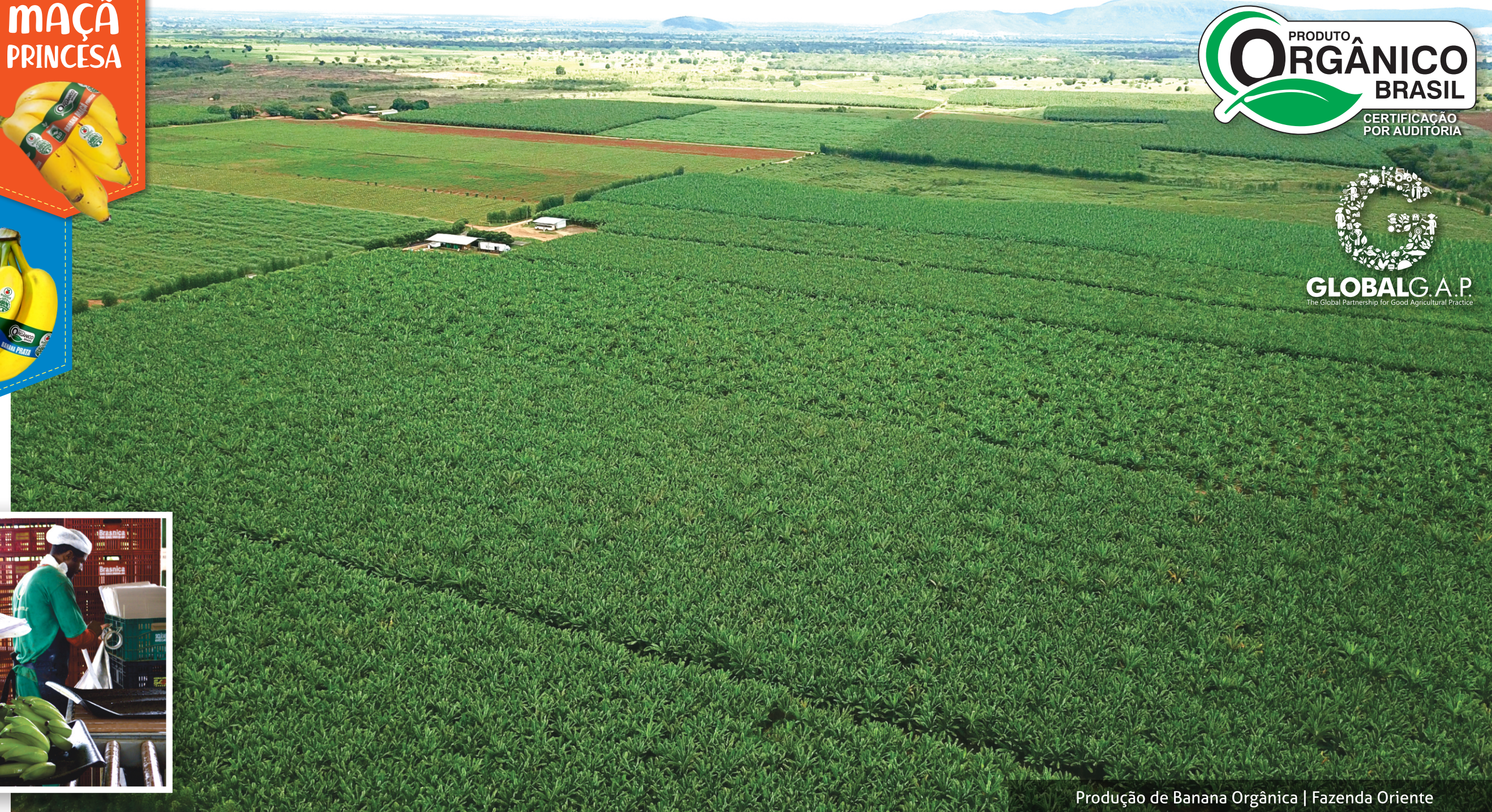
Produção de Banana Orgânica | Fazenda Oriente