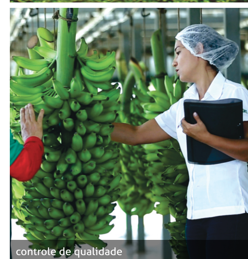
controle de qualidade