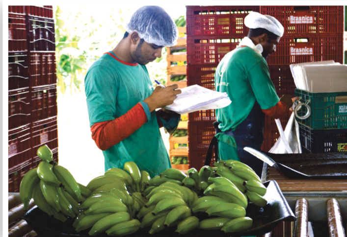
Inspeção de qualidade