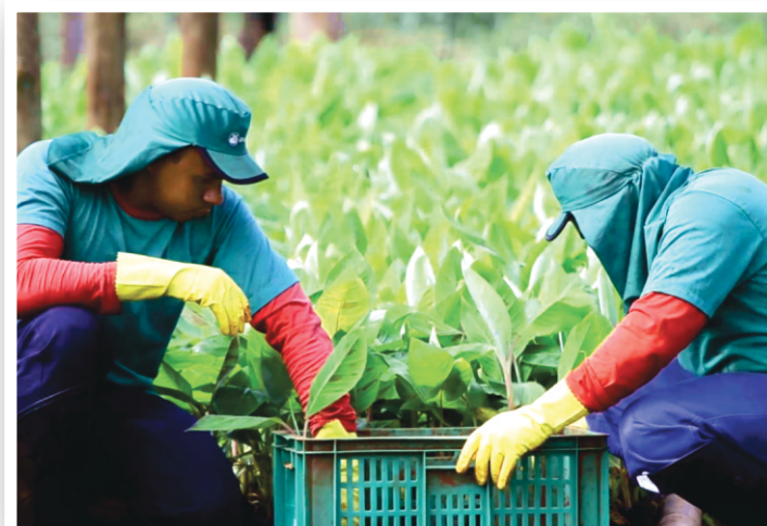
Seleção de Mudanças