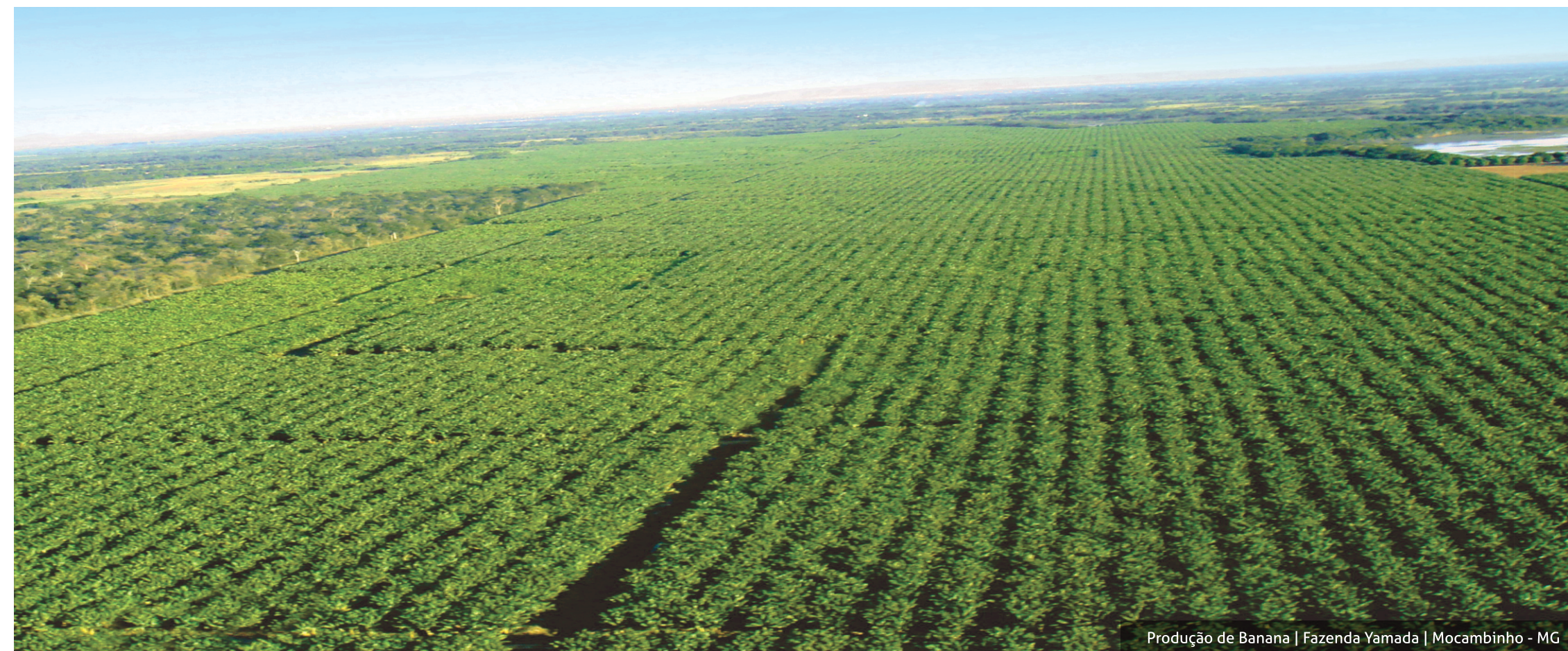
Produção de Banana | Fazenda Yamada | Mocaminho - MG